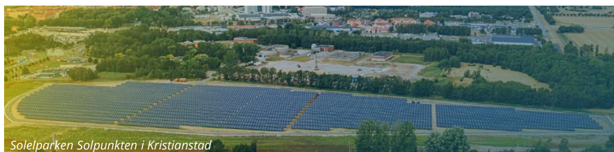
Solelparken Solpunkten i Kristianstad

Därför finns vi, Gigawattparken - en del av Solkompaniet .